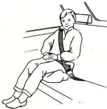
KLIPPAN ADJUSTABELT vyönalentaja